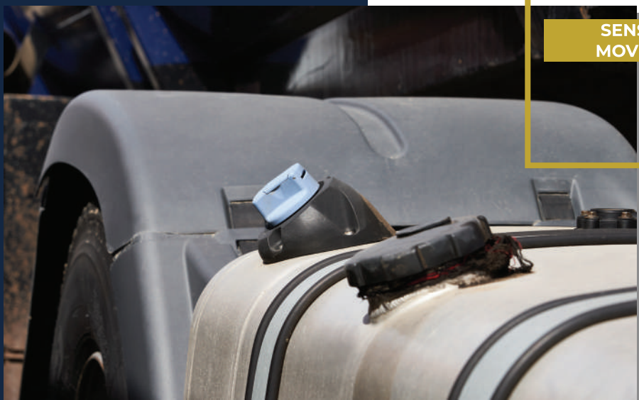
SENSOR DE MOVIMENTO

Com o TankControl, sempre que se verificar uma abertura indevida do tampão, para além de ser ativada a sirene, é também enviado em simultâneo um alerta quando ligado a um localizador GPS.