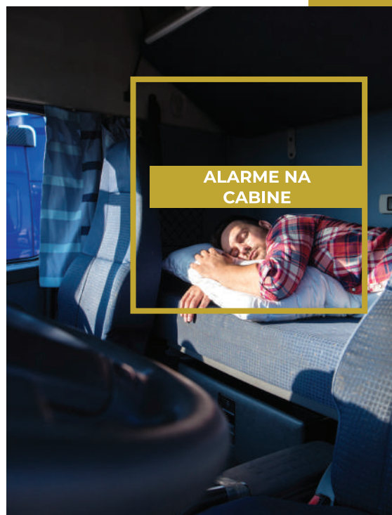
ALARME NA CABINE

O furto de combustível é algo que acontece com demasiada frequência aos profissionais e empresas de transportes. A subida constante dos preços de combustível acaba por tornar o problema ainda mais preocupante.